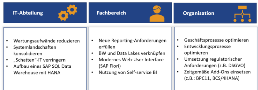
Abbildung: Motivationen für eine SAP BW/4HANA-Migration

Die daraus abzuleitenden Ziele und Empfehlungen für die Migration zu erkennen und Handlungsempfehlungen daraus abzuleiten ist nur einer der Schwerpunkte des Workshops.